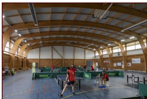
Tournoi Au gymnase