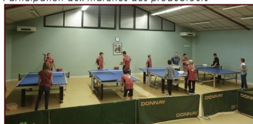
Entrainement des jeunes