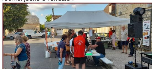
Participation aux marchés des producteurs