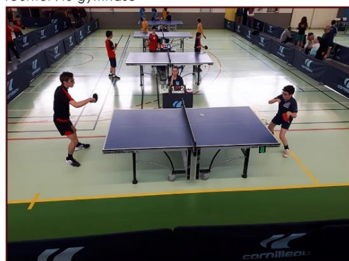
Tournoi jeune à Terrasson